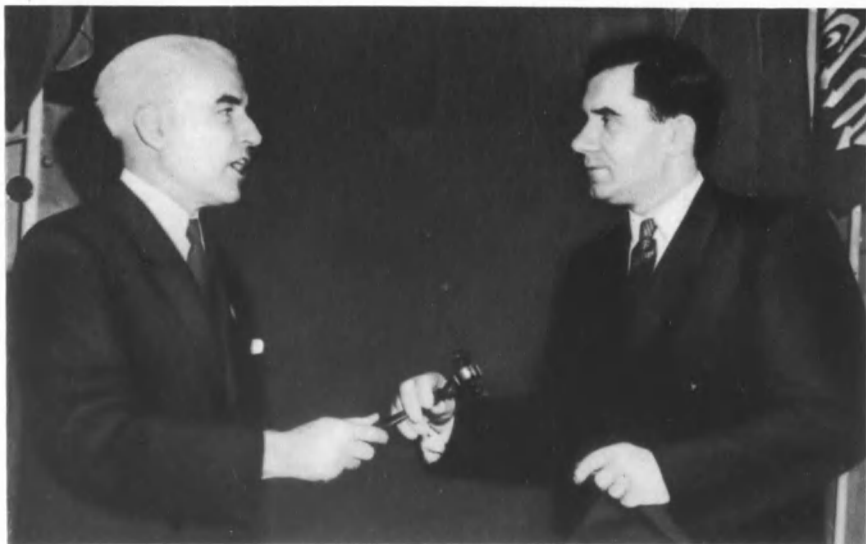
Глава делегации США Э. Стеттиниус передает главе делегации СССР А. А. Громыко молоточек председателя конференции в Сан-Франциско. Август 1945 г.