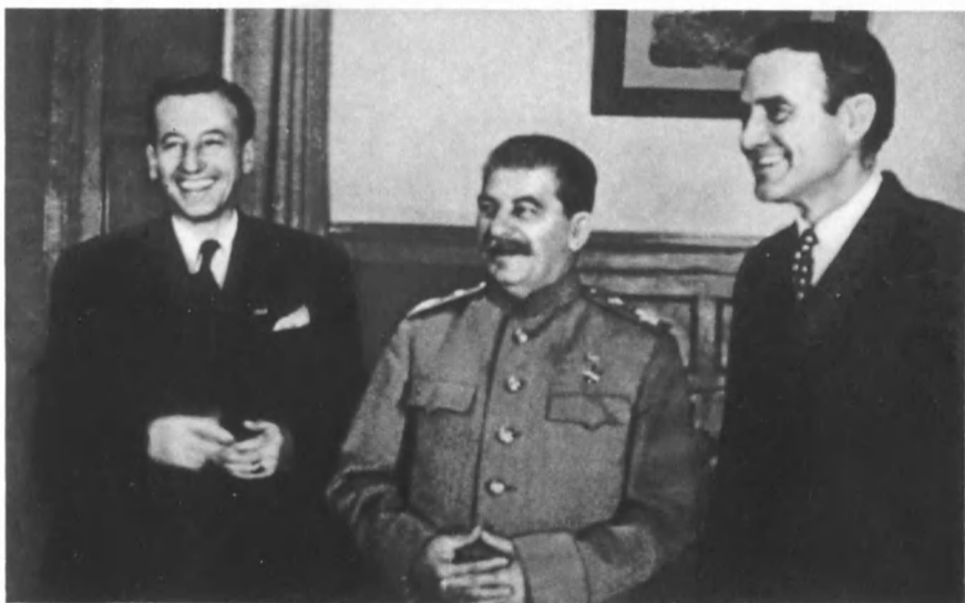
Прием председателя торговой палаты США Джонстона (слева) И. В. Сталиным. Справа — А. Гарриман. 26 июня 1944 г.