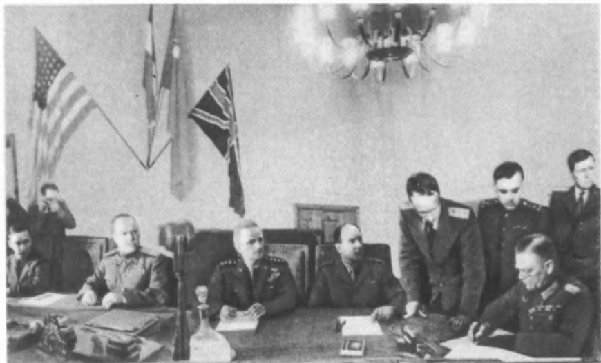
Подписание Акта о безоговорочной капитуляции фашистской Германии. Карлсхорст, 8 мая 1945 г.