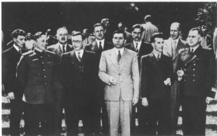
Советская делегация на конференции в Думбартон-Оксе. Сентябрь 1944 г.