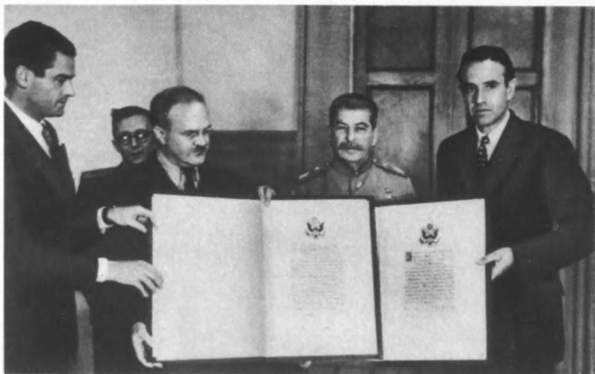
Вручение А. Гарриманом И. В. Сталину почетных грамот Ф. Рузвельта для Ленинграда и Сталинграда. 26 июня 1944 г.