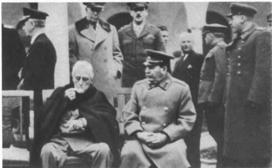
Ф. Рузвельт и И. В. Сталин во время Крымской конференции. Ялта, 1945 г.