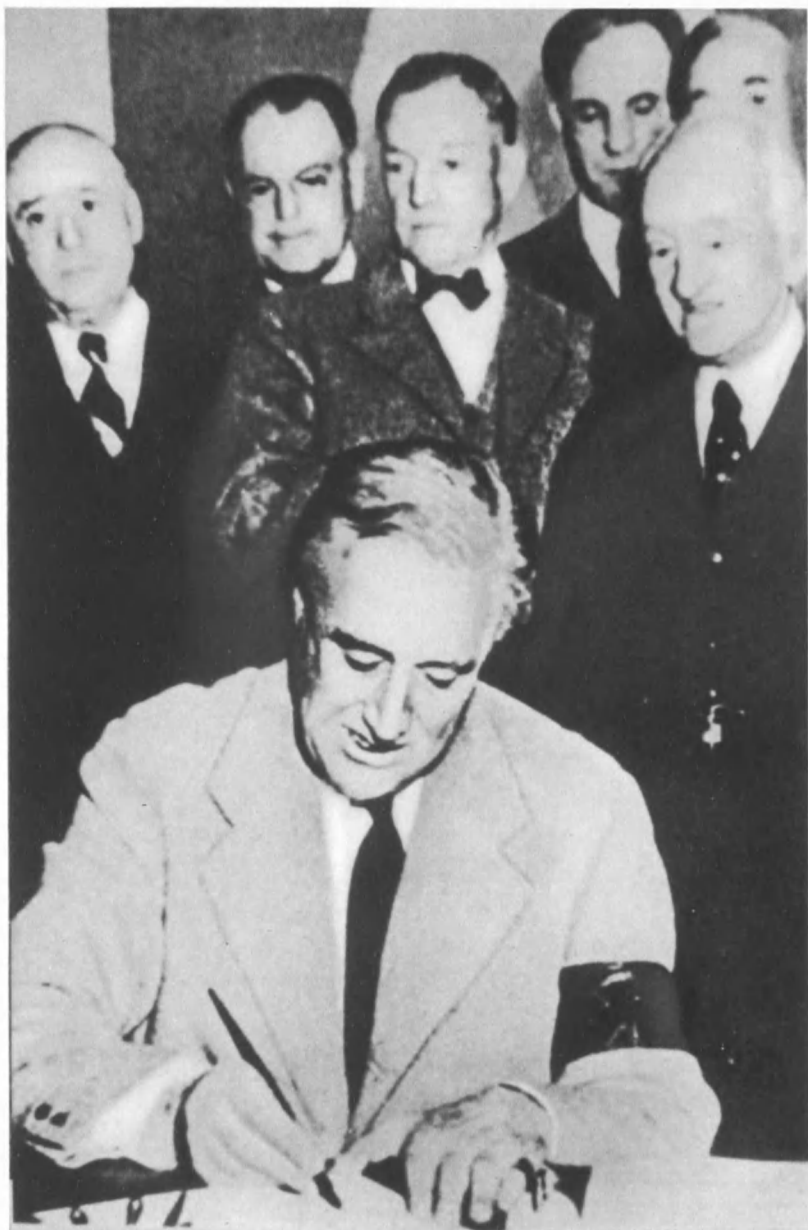
Президент США Ф. Д. Рузвельт подписывает декларацию о вступлении США в войну. Декабрь 1941 г.