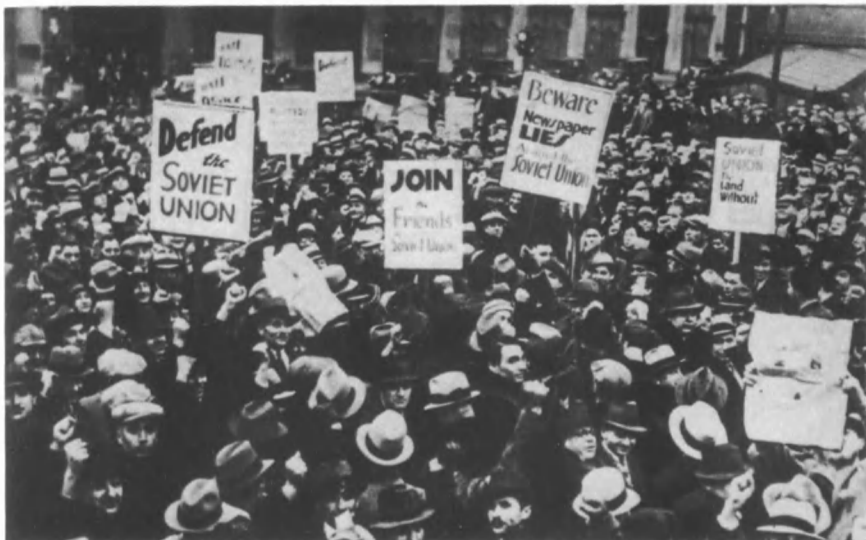
Митинг солидарности с СССР в Нью-Йорке