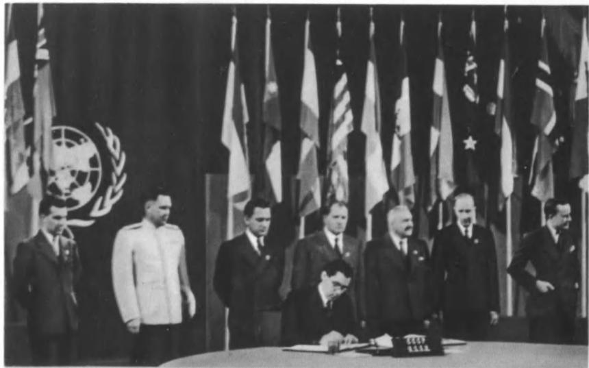
Глава советской делегации на конференции в Сан-Франциско подписывает Устав ООН. 26 июня 1945 г.